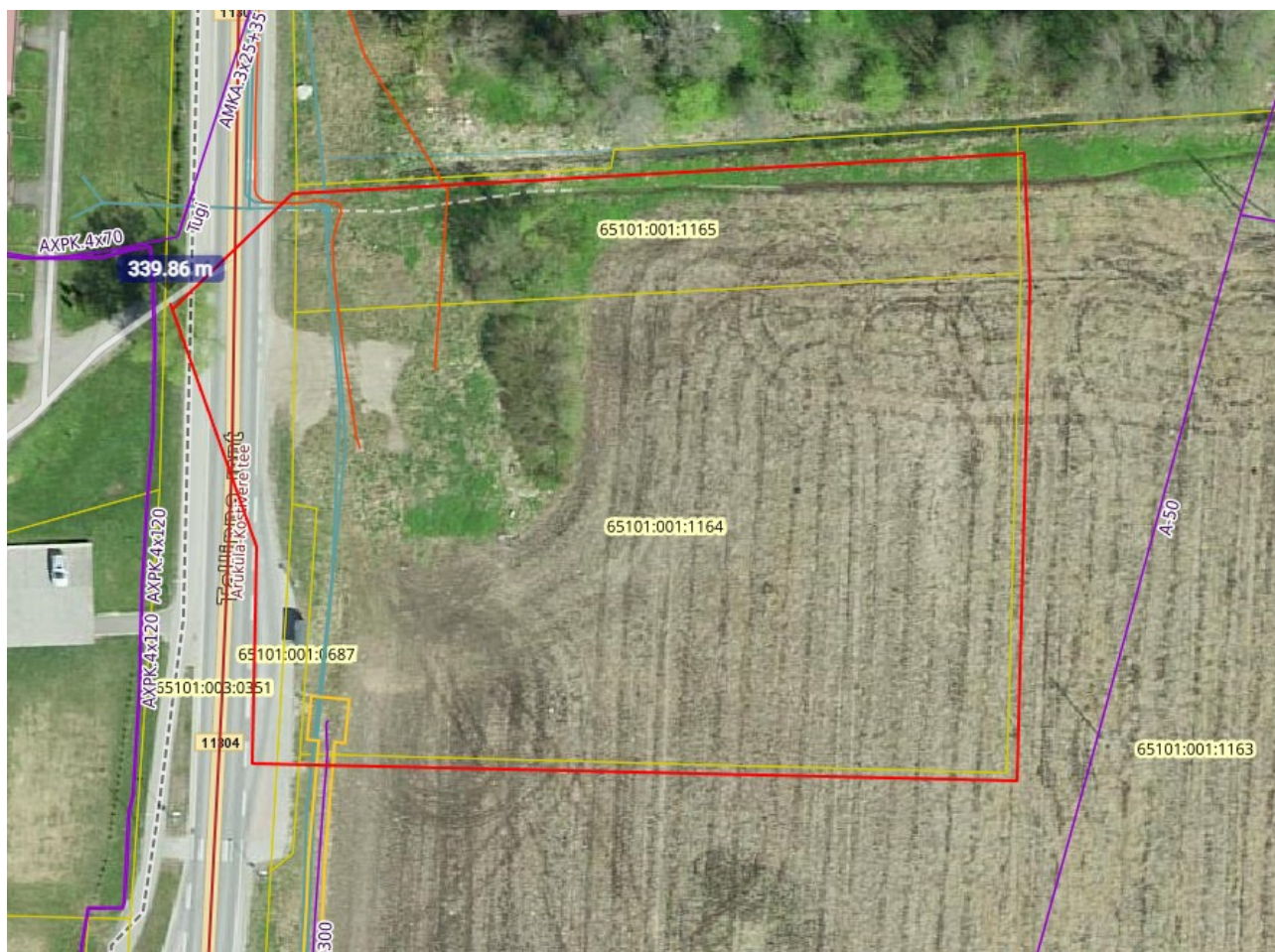
Joonis 1. Tööde piirkond.

Punase joonega tähistatud projekteerimist käsitlev ala kinnistul Tallinna mnt 33.